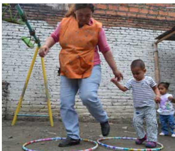
Figura 1. Actividades de estimulación temprana y desarrollo psicomotriz, CIBV Gotitas de Amor.