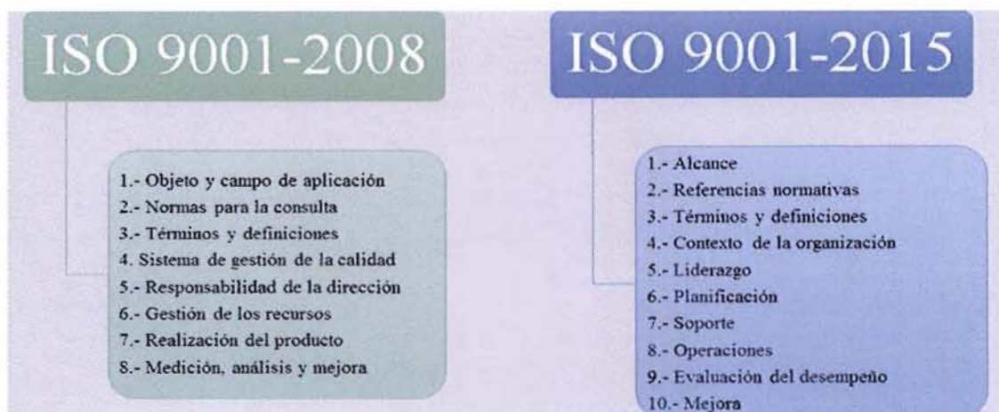
Figura 2. Nueva Estructura de la Norma ISO 9001-2015

La norma ISO 9001-2015 no solo cambio su año de versión, sino que también modifiko su estructura (véase en la Figura 2).