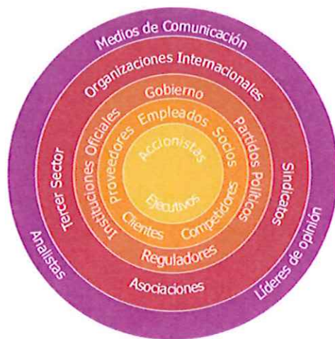
Ilustración 1. Objeción de las Empresas a las perspectivas de la Sociedad

2007). “Se frecuente del propio planteamiento en que se basa el mismo Estado, que manipula a la empresa como vehículo para inmiscuirse en el medio social, al través de la política económica y social” (Marchant, 2006). Debe existir una alianza en conjuntas partes, el Estado y los empresarios, por intermedio de esta unión existan responsabilidades satisfactorias a beneficio de la sociedad en común.