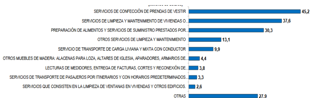
Gráfico 2. Principales rubros adjudicados a AEPS hasta agosto 2017