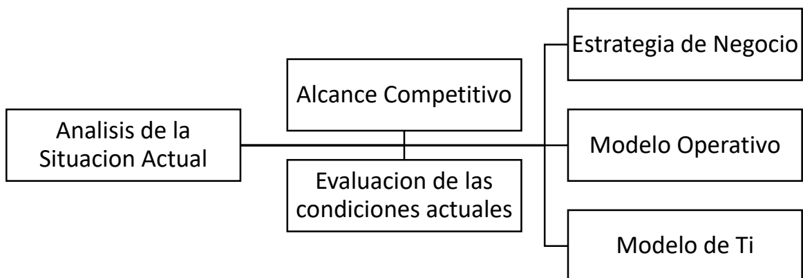
Ilustración 2 Análisis de la Situación Actual