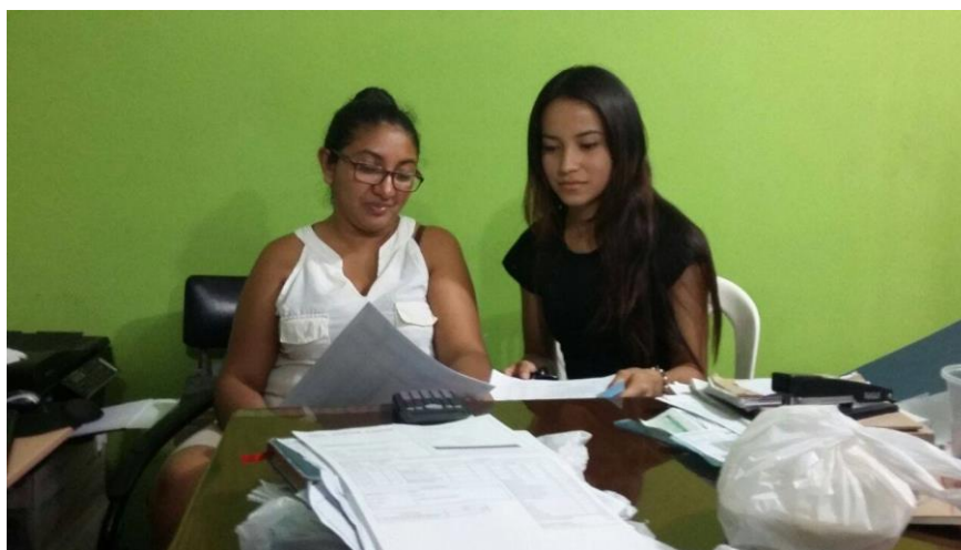
Figura 1. Entrevista con la contadora