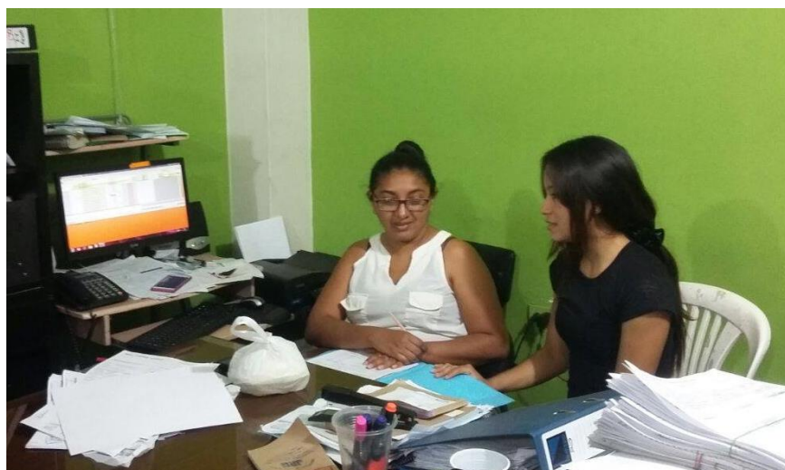
Figura 2. Entrevista con la Contadora