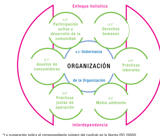
Figura 1: Responsabilidad Social: 7 materias fundamentales

Para las empresas la sostenibilidad en sus acciones debe representar no solo el proveer de productos y/o servicios que cubran las necesidades de los demandantes, sino que las acciones ejecutadas sean en un plan de conservar el ambiente y operar de una manera ética, legal y responsable.