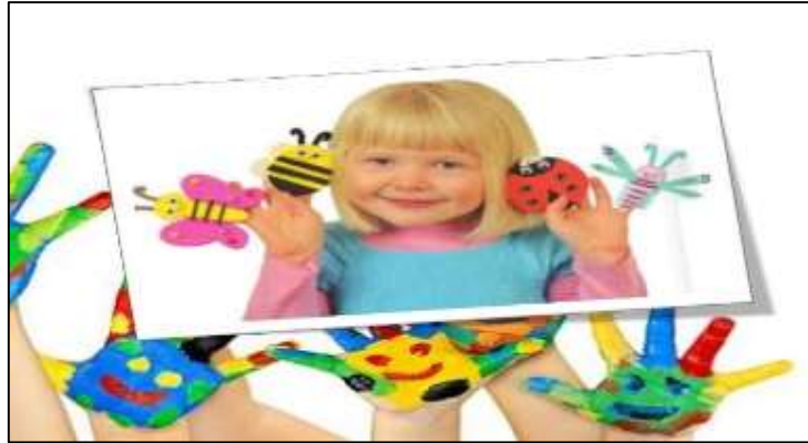
Imágen N° 3: Actividad con el docente