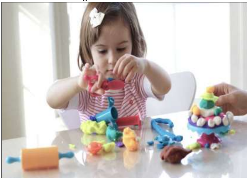
Imágen N° 2: Motricidad fina