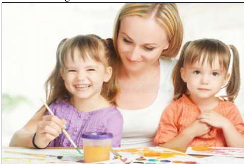
Imágen N° 4: Actividad con la familia