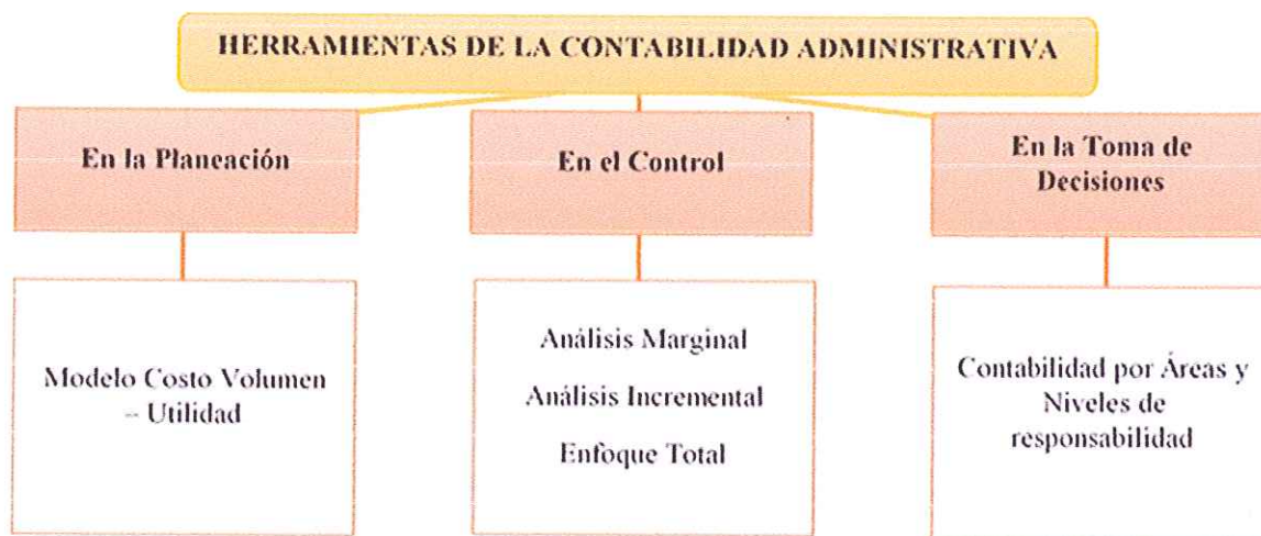
Ilustración 2 Herramientas de la Contabilidad Administrativa