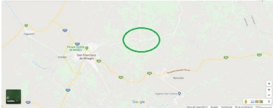
Figura 3 Ubicación Geográfica Mariscal Sucre

medio de recomendaciones de conocidos, no aplican el proceso de como capacitar o motivar el personal (Aguilar, 2007).