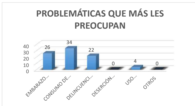
Figura 3: Problemáticas que más les preocupan.

Gracias a la encuesta realizada en la comunidad El Ceibo también se determinó que la delincuencia juvenil es la tercera problemática que más preocupa a los padres y madres de familia de esta zona. En cuarto lugar, se ubica el uso inadecuado de redes sociales, mientras que la deserción escolar, aunque se puso como alternativa, no fue marcada como preocupante para ninguno de los padres y madres de familia que fueron consultados.