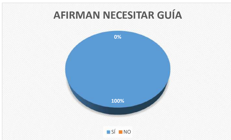
Figura 4: Afirman necesitar guía.

Escuela para Padres en la cual se les brinde la guía sobre los temas antes mencionados. Un 87% de los padres y madres de familia encuestados afirmaron su deseo de participación, mientras que el 13% aseguró que no desea participar. También es importante destacar que, de los cuarenta encuestados, treinta y nueve desean que la Escuela para Padres se establezca en su comunidad; y tan solo uno considera que una mejor opción es realizar la Escuela para Padres en el centro de la ciudad de Milagro.