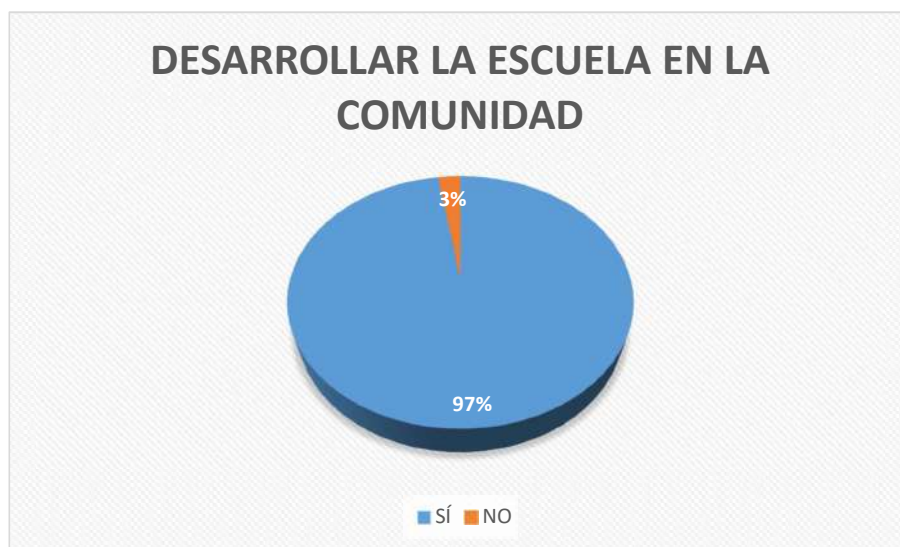
Figura 6: Desarrollar la escuela en la comunidad.