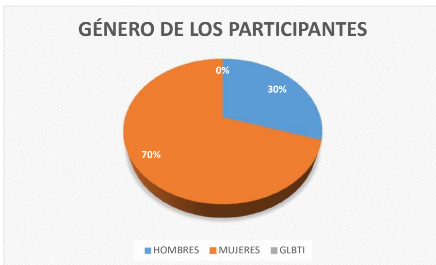
Figura 1: Género de los participantes.

comunidad suelen estar trabajando en los cultivos durante el día, lo cual podría explicar que hayan respondido la encuesta muchas más mujeres que hombres.