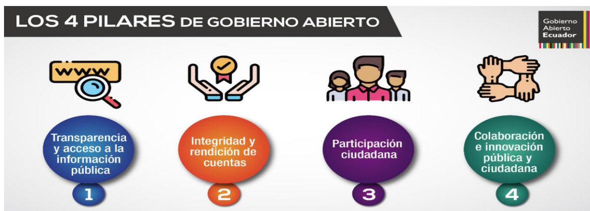
Figura 3 Pilares de sustentan la Alianza Para Gobierno Abierto Ecuador

Aquí la entidad municipal presenta en su pagina web informes del año 2016 al año 2019, estando pendiente el periodo económico 2020, su deliberación pública se fundamenta en los otros dos pilares restante como son la “Participación Ciudadana” y la “Colaboración e innovación pública y ciudadana” (ver figura 3)