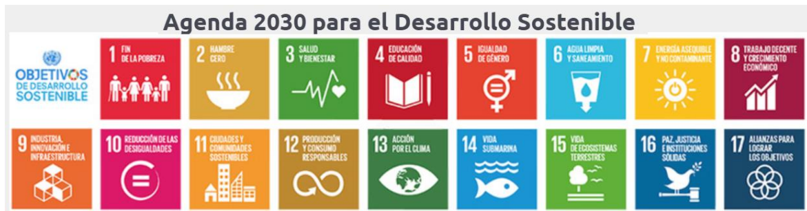
Figura 1 Objetivos de Desarrollo Sostenible – ONU Agenda 2030