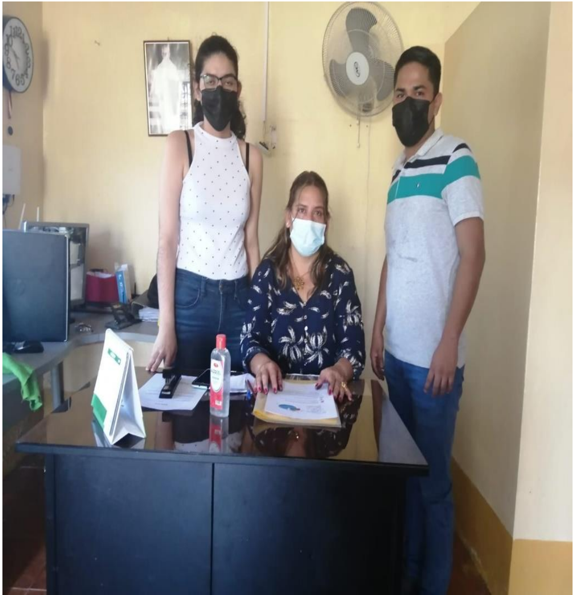
Conversación con la directora de la Institución