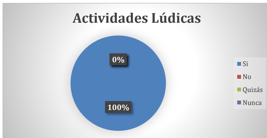
Gráfico 4. Actividades Lúdicas