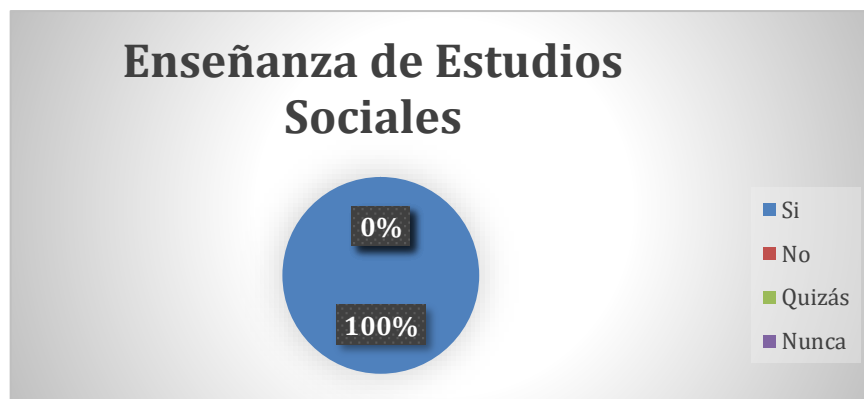
Gráfico 1. Enseñanza de Estudios Sociales