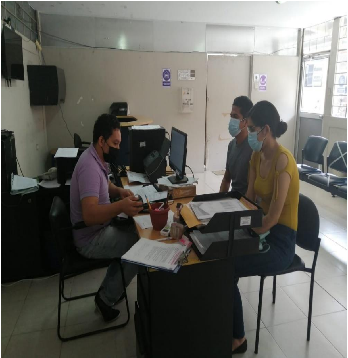
Entrega de la solicitud al distrito