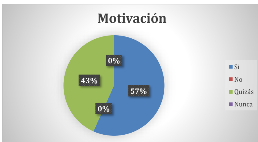
Gráfico 5. Motivación