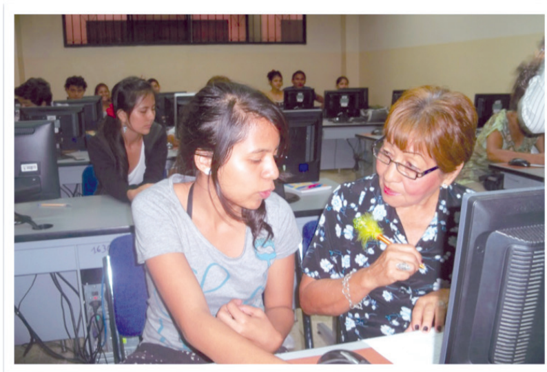
Imagen 1. Estudiantes propiciando el Aprendizaje del adulto mayor

sión en la muestra de grupos supuestamente típicos” [6]. Para el estudio se consideró las organizaciones que aglutinan adultos mayores del cantón Milagro, las cuales se describen en la Tabla 1.