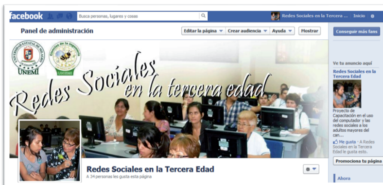
Imagen 3. Fan Page del proyecto.

Se llevó a cabo una encuesta de satisfacción, en las organizaciones que agrupan a los adultos mayores, participantes del proyecto. El