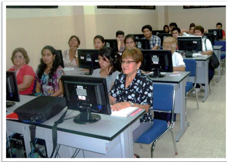
Imagen 2. Grupo 1 de adultos mayores.

nico y uso de la red social Facebook. El 100% de los participantes (Imagen 2) crearon su cuenta de correo y a través de la herramienta de mensajería instantánea o chat lograron conversar entre ellos e incluso con