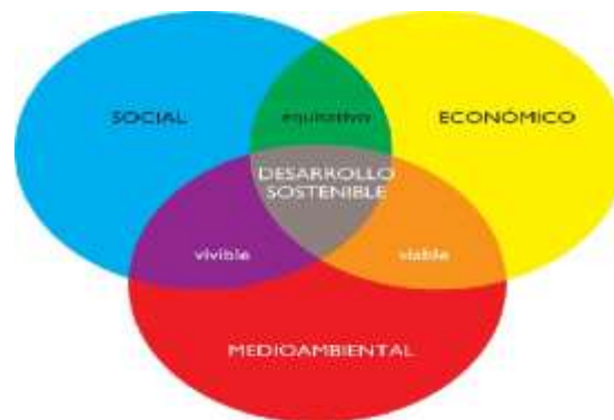
Ilustración 1 La responsabilidad social y el desarrollo sostenible