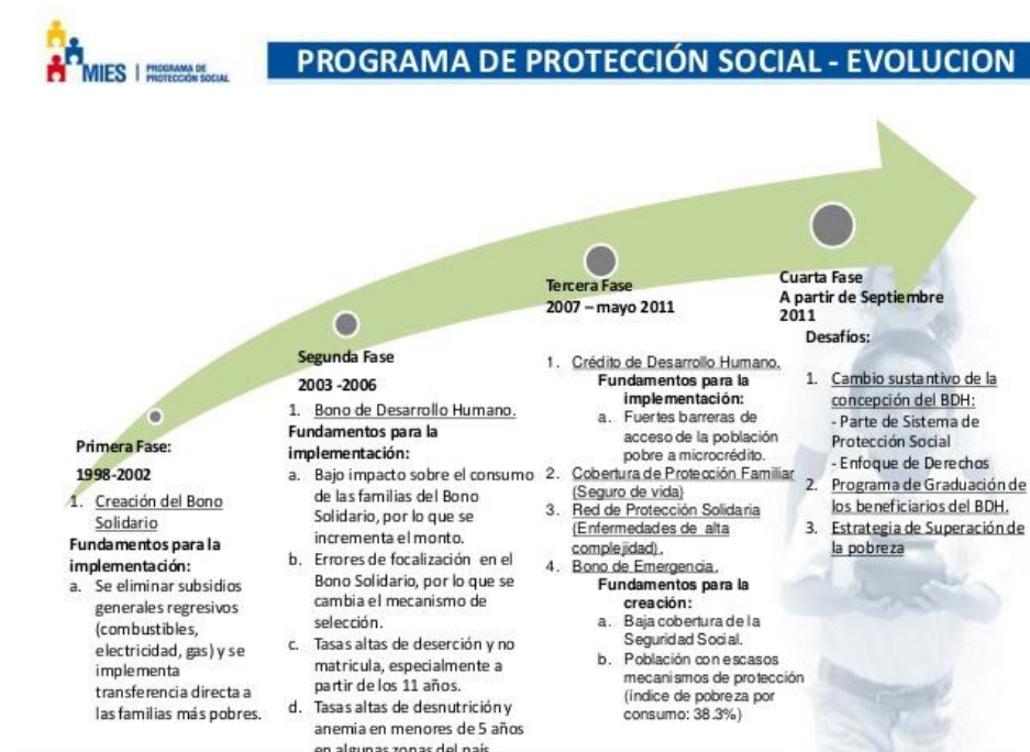
FIGURA 1. EVOLUCIÓN DEL BDH

Este tipo de programas se encuentran dentro del Viceministerio de Aseguramiento no Contributivo y Movilidad Social, están marcados por los Programas de Transferencias Monetarias Condicionadas, y ejecutado por el Ministerio de Inclusión Económica y Social (MIES). Se presenta como un subsidio entregado a los representantes de los núcleos familiares, adultos mayores y personas con discapacidad, que se encuentran bajo la línea de pobreza, cuyo objetivo es ayudar a reducir la pobreza a través del fortalecimiento del capital humano.