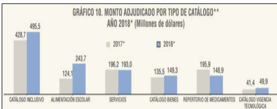
Figura 1 Monto Adjudicado por tipo de contratación

El sistema de contratación pública en la región merece una revisión del funcionamiento del proceso de adquisiciones, que implica un escrutinio de los principales aspectos de la gestión pública nacional de los sistemas de adquisiciones en un grupo de países en las tres subregiones de América Latina y Caribe. Durante los años 2017 y 2018, el monto por contratación pública fue de $ 6.813 millones de dólares; de los cuales se establece que $ 3.711 millones que es el (54%) se realizaron con el régimen común y $ 3.102 millones (46%) por procedimientos de régimen especial, así describe la figura 4.