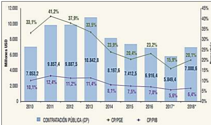
Figura 2 Evolución anual y porcentaje de participación de la contratación pública (Millones de dólares y % de representación)