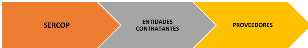
Figura 1 Actores de la contratación pública

Para percibir este tipo de programación en los procesos de la contratación pública esencial, es necesario primero identificar quienes son los actores principales que manejan estas actividades. En la figura 1 se describen los actores de la contratación pública, entre ellos se destacan los elementos analizados en el proceso de contratación pública.