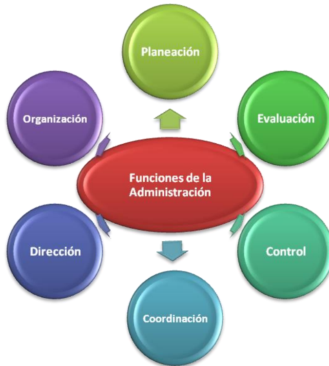
Figura 1. Técnicas de la administración