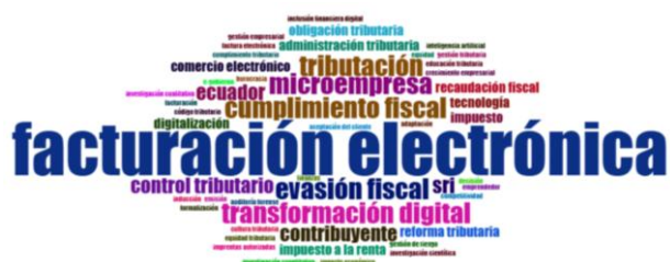
Figure 1. Nube de palabras clave de la literatura revisada

Adicionalmente, se ejecutó un Análisis de tendencia lineal y se calculó la Variación porcentual interanual con el fin de cuantificar el ritmo de crecimiento de tributos fundamentales como el IVA y el Impuesto a la Renta. Para evaluar la eficiencia del control institucional, se realizó un Análisis de correlación de Pearson entre los montos de multas y la recaudación total, buscando determinar si la optimización de la facturación electrónica ha influido en la relación entre el cumplimiento voluntario y la aplicación de sanciones. Todo el tratamiento de la información se sustentó en un análisis documental que, bajo los lineamientos de Ordoñez (2025), facilitó la identificación de regularidades conceptuales y ejes temáticos en el comportamiento fiscal, cuya distribución temática se sintetiza en la Figura 1. El procesamiento integral de los datos, desde la depuración de las bases del Servicio de Rentas Internas hasta los cálculos de varianza, se desarrolló mediante scripts en R, garantizando la reproducibilidad y el sustento técnico de los resultados presentados a continuación.