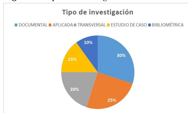
Figura 3. Tipo de investigación

Respecto a los resultados y aportes científicos, el análisis muestra que 12 estudios (60%) reportan aportes vinculados al diseño curricular o modelos pedagógicos basados en competencias, evidenciando la preocupación por la coherencia entre resultados de aprendizaje, metodologías y evaluación. Asimismo, 5 investigaciones (25%) destacan el desarrollo de herramientas o estrategias para la evaluación por competencias, mientras que 3 estudios (15%) se enfocan en competencias emergentes como digitalización, sostenibilidad o inteligencia artificial en educación superior. Estos hallazgos permiten identificar que la principal línea investigativa actual se orienta hacia la transformación curricular, seguida por la evaluación auténtica y la incorporación de nuevas competencias vinculadas a la innovación educativa.