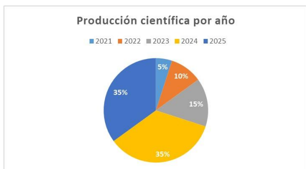
Figura 2. Producción por año

En relación con el tipo de investigación, los estudios incluidos muestran una predominancia de enfoques documentales y analíticos. Específicamente, 6 investigaciones (30%) corresponden a revisiones sistemáticas o estudios documentales, 5 estudios (25%) se clasifican como investigaciones aplicadas o de diseño curricular, 4 estudios (20%) son de carácter cuantitativo o transversal, 3 estudios (15%) corresponden a estudios de caso o reportes de experiencia, y 2 investigaciones (10%) son análisis bibliométricos o conceptuales. Esta distribución evidencia que el campo aún se encuentra en una fase importante de consolidación teórica y estructuración conceptual, aunque progresivamente se incrementan los estudios empíricos orientados a