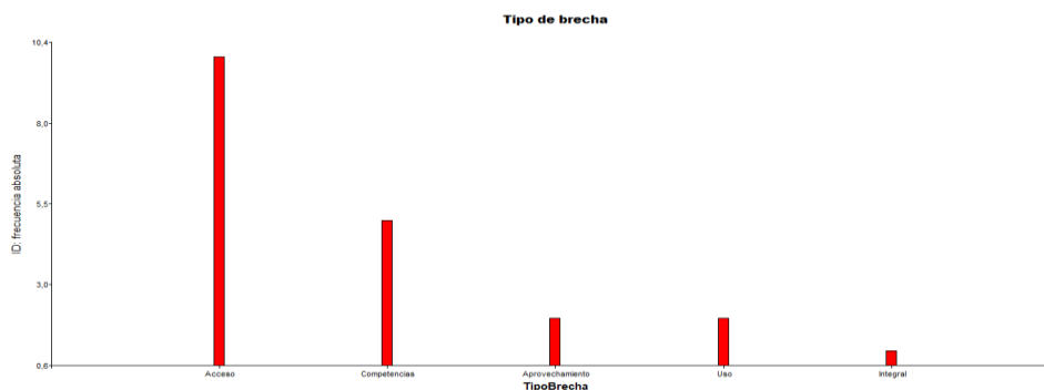
Figura 3. Distribución de tipo de brecha

El análisis de contingencia evidencia que la mayoría de los estudios revisados se concentran en la brecha digital de acceso, representando el mayor porcentaje de la literatura analizada. Este tipo de brecha se relaciona principalmente con problemas de infraestructura tecnológica, conectividad y disponibilidad de dispositivos en el sistema educativo ecuatoriano.