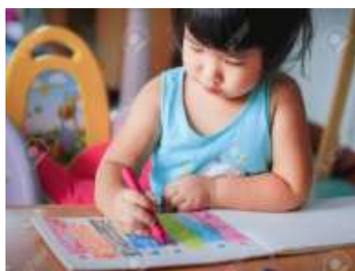
Ilustración 1 Person coloring with crayon. Gusov (2018)

Aplicación: sencillamente para su desarrollo se utilizará crayones y lápices de colores donde los niños procederán a pintar ya sea dibujos o también áreas libres como por ejemplo hojas blancas. Es recomendable que los colores sean variables para no entrar al estudiante en una rutina monótona, también debemos tener en cuenta que al inicio se pintará con crayones y ya al momento de que el infante haya dominado su manipulación se emplearán los lápices de colores, es decir que se pasará de trazos gruesos a trazos finos.