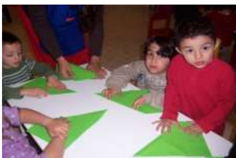
Ilustración 18. El Rincón De Aprender. WordPress (2016)

Aplicación: el plegar papel se considera un arte la misma que contribuye al niño en su coordinación motriz; para su ejecución se necesita cualquier tipo de papel que sea manejable y de fácil doblar, el docente mostrará a los niños de qué manera irán doblando el papel dando instrucciones de cómo hacerlo y los niños al observarlo imitarán los pliegues. También se puede dejar a criterio del infante los dobleces que deseen realizar y así formar diferentes figuras, (Mesonero & Torío 1996).