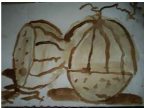
Ilustración 8. Técnica del café art- escolar. Ramos (2013)

Aplicación: para el desarrollo de la técnica se necesitan café, agua y goma, estos materiales se los mezcla hasta conseguir una pasta homogénea, a continuación se procede con la ayuda de un pincel, dedos o cotonetes para untar la mezcla sobre un dibujo predeterminado o una hoja blanca; al secar el dibujo tendrá un aspecto de iluminación.