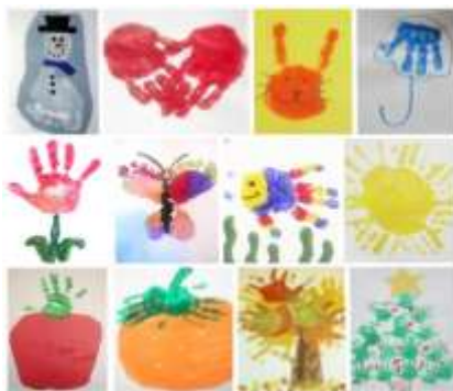
Ilustración 4. Expresión artística. Pita (2018)

Aplicación: los instrumentos a utilizar en esta técnica son la pintura y las manos, el niño una vez sumergida su mano en la pintura procederá a realizar libres movimientos sobre el papel, estos pueden ser con los dedos, puños, palma de las manos e incluso plasmar sus manos. Esta técnica ayudará al niño en su sensibilidad táctil, estimular su creatividad y su coordinación viso-motora. Es recomendable que no se limite al niño al momento de emplear la técnica pues mientras más el infante realice los movimientos sobre el papel podrá descubrir muchas formas y líneas (Chimbo, 2018).