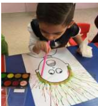
Ilustración 5. Dieu s'occupe de mes cheveux. Annechoisilavie (2016)

Aplicación: para Díaz, Santiago, Benítez y Acosta (2014) en el desarrollo de esta técnica se necesitarán témperas, agua, sorbete y un lienzo; se mezcla la témpera con un poco de agua, luego se introduce el sorbete, se lo saca y dejamos gotear sobre el papel, una vez que estén las gotas se sopla con el sorbete para que estas se esparzan dando lugar a que se formen