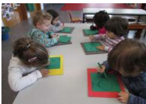
Ilustración 19. Motricidad fina. Alquería (2014)

Aplicación: los materiales que se utilizan en esta técnica son una hoja o dibujos en papel y un lápiz o aguja sin punta. Se procede a punzar todo el dibujo por el borde hasta lograr desprenderlo del todo o una parte. Esta actividad le ayudará al niño a desarrollar el músculo