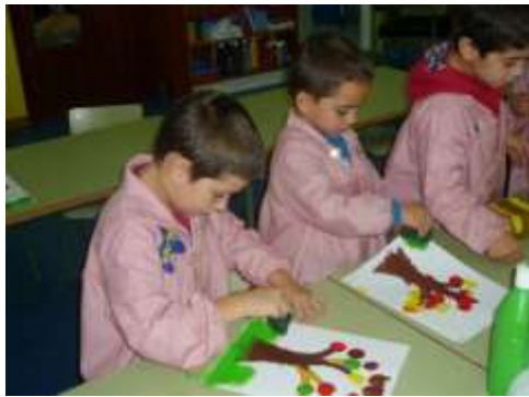
Ilustración 6. O recanto de Mari. González (2014)

Aplicación: para la realización de la técnica se utilizará un sello y pinturas, según Carlos, Covarrubias y Enríquez (2016) consiste en sumergir el sello en la pintura y luego se aplica el sello empleando una pequeña presión sobre el papel, quedando así estampada la figura. Los beneficios que posee la técnica del sellado es que genera en el niño la libre expresión además el reconocimiento de las manos como su mecanismo de acción. Conviene subrayar que el docente juega un papel primordial en esta actividad ya que es él quien crea los sellos y depende de la creatividad para el diseño de los mismos, se los puede elaborar con esponja, vegetales, hilos, plastilina, borradores y hasta hojas de árboles.