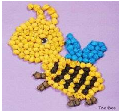
Ilustración 15. Técnicas Grafoplásticas: Arrugado. May (2018)

Aplicación: en el desarrollo de esta técnica se utilizará goma y papel crepé que es el más adecuado para realizarla debido a su textura suave y de fácil manejo. Se troza pequeños pedazos de papel y con el dedo índice y pulgar damos movimientos circulares al papel hasta formar bolitas. La técnica del arrugado aumenta la capacidad para controlar los músculos de los dedos.