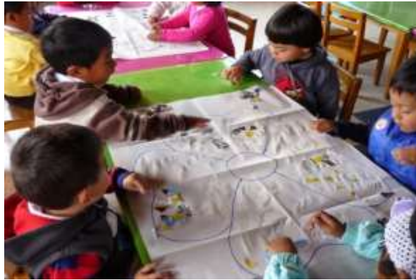
Ilustración 12. Técnica grafoplástica trozado. Quirola (2018)

Aplicación: la técnica del trozado consiste en trozar papeles de diferentes espesores utilizando los dedos índice y pulgar; las manos se encuentran en constante movimiento lo que genera en el niño el desarrollo de la pinza digital. Los papeles trozados pueden ser de varios tamaños, se los utilizará para actividades como rellenar dibujos, bordear siluetas de dibujos, pegar libremente en hojas, entre otras. Al momento de pegar los papeles se les indicará a los niños que deben colocar puntitos de goma en el espacio donde plasmará los papeles y que lo realizará con el dedo índice de la mano que él domina.