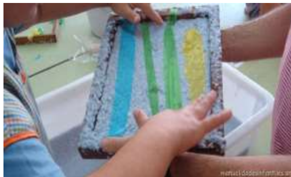
Ilustración 11. Manualidades Infantiles (2015)

Aplicación: la masa maché se realiza con papel de diversas clases tales como papel periódico, papel higiénico u hojas blancas, para obtener la masa se coloca en un recipiente papeles trozados lo más pequeños que puedan ser, se les agrega agua y se deja reposar; cuando estén bien remojados se procede a licuar la mezcla. El resultado que se obtendrá será una masa uniforme, la cual se escurrirá bien para su utilización, con este material el niño efectuará distintos dibujos mediante el modelado de la masa (Villegas, 2017).