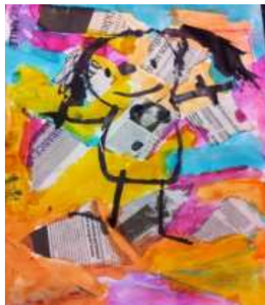
Ilustración 16. Collage. Crmomanova (2018)

Aplicación: existe una gran gama de materiales que se pueden utilizar para realizar la técnica del collage tales como papeles, periódicos, revistas, botones, telas, además materiales de la naturaleza como semillas, hojas, flores, incluso arena. El niño descubrirá texturas, formas, colores, tamaños al ir pegando todos los materiales para formar el collage, esto