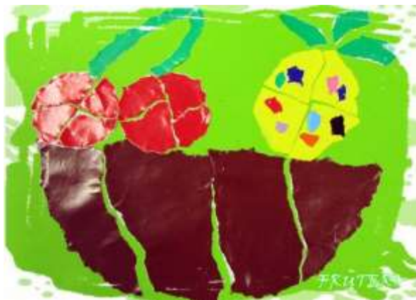
Ilustración 13. Manualidades Infantiles (2015)