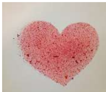
Ilustración 3. La plástica en el desarrollo infantil. Márquez (2018)

Aplicación: para el desarrollo de esta técnica se necesita un cepillo de dientes el mismo que será sumergido en pintura, luego se procederá a raspar el cepillo con los dedos para que la pintura salpique la hoja con la plantilla (Olguín, 2015). La pluviometría aportará en el desarrollo de la inhibición palmar y contribuirá en la percepción figura-fondo.