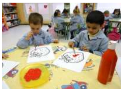
Ilustración 2 Perspectiva de la educación artística. Méndez (2014)

Aplicación: para la ejecución de esta técnica se contará con pinceles de diversas medidas y pinturas de diferentes colores, a medida que el niño vaya adquiriendo la destreza se irán disminuyendo las medidas del pincel y también el espacio donde se está pintando, de esta manera ayudará a formar el acto prensor. Es importante enseñarle al niño que el pincel