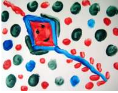
Ilustración 9. Puertas a la imaginación. Cartagena (2013)

Aplicación: los materiales a utilizar son témperas o pinturas, pasta de dientes, dibujos o papel en blanco; primero se coloca en un vaso pasta dental, a esta pasta se le añade un poco de pintura, se mezclan los ingredientes y se procede a pintar el dibujo. Es importante indicar que para realizar la técnica de la pasta dental no es necesario que el niño pinte el dibujo con pinceles ya que si utiliza los dedos directamente será de gran beneficio para que logre desarrollar la pinza dactilar (Kids Emotion, 2018).