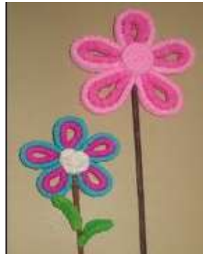
Ilustración 17. Creando ando un mundo en papel. Karencitha 26 (2016)

Aplicación: Con esta técnica lo que se pretende lograr es que el niño adquiera presión sobre el papel para que ejercite continuamente sus dedos índice y pulgar de ambas manos. Para la realizar la técnica se utilizan tiras de papeles las cuales el niño torcerá con ayuda de un lápiz al inicio y cuando se presente el dominio total lo podrá hacer únicamente con sus dedos.