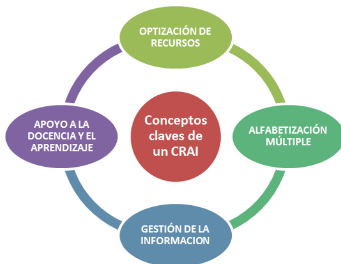
Figura1. Elementos claves de un CRAI

y secciones de un CRAI, sin embargo (Area, 2005), citado por Zamora, 12 ; identifican cuatro conceptos claves para definir un CRAI de una universidad, estos elementos se detallan en la Figura 1.