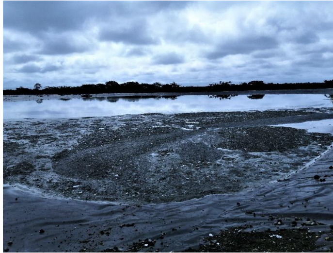
Figura 3 Piscina anaeróbica del STAR

El vertido de aguas residuales al ambiente, sin un proceso de depuración ocasiona daños no solo ambientales sino también a la salud de las personas, por lo que el tratamiento de estas aguas antes de su vertido se vuelve indispensable (Alianza por el agua, sf).