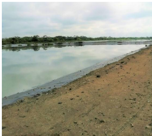
Figura 4 Piscina de fermentación del sistema de tratamiento del STAR

El tratamiento químico de aguas residuales corresponde a aquel que se desarrolla mediante la adición de reactivos químicos al agua, se usa para aumentar la calidad del efluente. El método de tratamiento químico utilizado depende de las características que deba tener el efluente; habitualmente se empieza con una fase de precipitación química para eliminar el fósforo y regular el pH. En el proceso de tratamiento físico se consideran las propiedades físicas del contaminante. El método más común es la coagulación - floculación. Este tipo de tratamiento presenta ventajas considerables en cuanto a las variaciones tanto de caudal como de composición; flexibilidad en el diseño y posibilidad de adaptación a las características del vertido (Aguilar, Sáez, Llorens, Soler, & Ortuño, 2002).