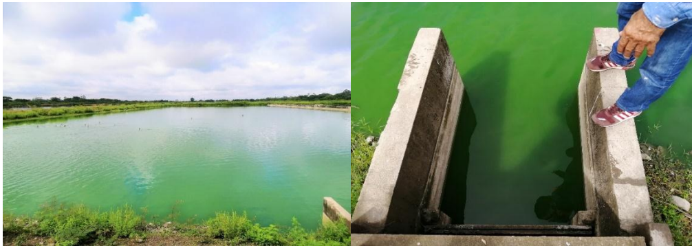
Figura 5 Piscinas de maduración del sistema de tratamiento de aguas residuales de GAD de Milagro

En el ámbito de la planificación, se puede observar en las tablas de observación (1 a la 4), que los resultados que los procesos, químico y físico, no definen sus objetivos, políticas y normativas; por lo tanto, son aspectos que llevarían al incumplimiento de normativas administrativas que aseguren un sistema de aguas residuales que sea manejado de forma salubre al cien por ciento; por ende, se estaría dando a paso a focos de insalubridad en determinados momentos. El recurso agua se considera contaminado cuando se ven alteradas sus características químicas, físicas, biológicas o su composición, perdiendo potabilidad o aptitud para el consumo humano o para su utilización en actividades domésticas, industriales o agrícolas.