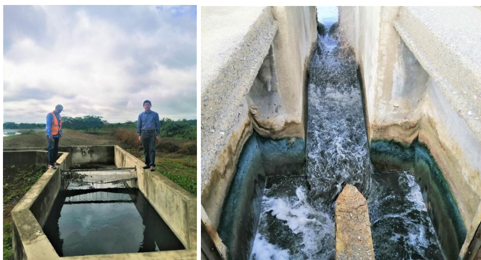
Figura 2 Ingreso del efluente a las piscinas anaeróbicas del STAR

Por su parte el Plan Nacional de Desarrollo PND 2017 - 2021, siendo el instrumento al que se sujetarán todas las políticas, programas y proyectos públicos, presenta también objetivos relacionados a la gestión integral del agua y saneamiento ambiental, así, en el eje uno del PND Derechos para Todos Durante Toda la Vida, en el objetivo primero, Garantizar una vida digna con iguales oportunidades para todas las personas, se define entre las políticas: “Garantizar el acceso, uso y aprovechamiento justo, equitativo y sostenible del agua; la protección de sus fuentes; la universalidad, disponibilidad y calidad para el consumo humano, saneamiento para todos y el desarrollo de sistemas integrales de riego” (Secretaría Nacional de Planificación y Desarrollo, 2017).