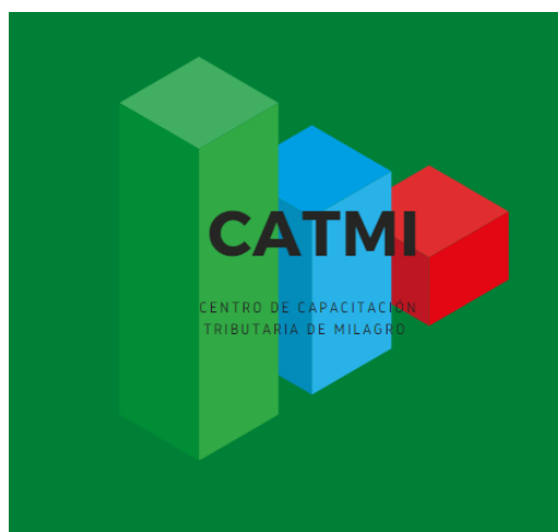
Ilustración 1 Logotipo de la Empresa

El slogan que se ha escogido es “Capacitación eficaz” de esta manera se busca generar confianza a los futuros profesionales que deseen actualizar sus conocimientos al contexto en el que se encuentre el país.